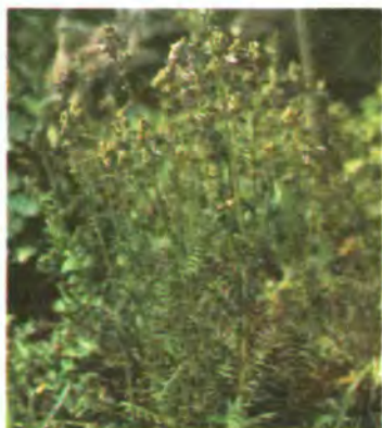
807. Синюха блакитна.